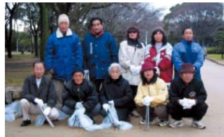
平成16年11月16日(日)公園清掃活動に参加された方々

公園愛護会の活動は、毎月第1・3日曜日の朝8時に集合し、清掃作業を行っています。早朝の清々しい空気に触れながら公園を清掃して歩くのは、心身共にリフレッシュでき、健康づくりにもつながります。清掃後には、今後の計画や園内の問題点などを意見交換しています。特に年々深刻となっているのが、花見シーズンのゴミの多さやカラス、ネコなどによるゴミの散乱です。しかし、昨年には大仙公園事務所で、ゴミカゴを撤去し、ゴミコンテナを22カ所、55基設置。一般ゴミはゴミコンテナ、缶ビンは専用カゴへという対策を打ち出していただいたおかげで、清掃も幾分やりやすくなりました。ゴミは各自で持ち帰る、外周道路や園内でタバコを投げ捨てない、など一人ひとりのちょっとした自覚と心遣いで、公園は、さらに美しくなるはず。大仙公園は市民の財産。この素晴らしい公園を守るには、愛護委員をはじめとする市民の力だということを、皆さんにも理解していただきたいと思っています。