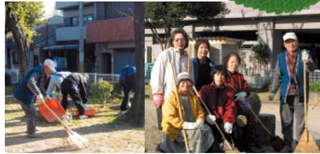
平成16年11月9日(日)公園清掃活動に参加された方々