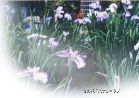
市の花「ハナショウブ」