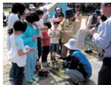
子ども達もうまく草笛を吹きました

この他にも、以前から子ども達が遊びながら学べるよう、木に名札を取り付けてほしいとの要望があり、4月20日(火)に大野芝公園で楽しく木々の名前を覚えながら取り付けていただきました。今後もこのような要望があれば、公園協会までご連絡ください。