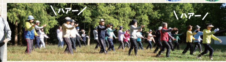
デューリーの構え